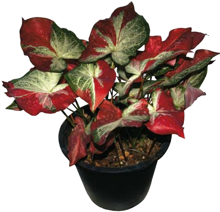
Shy Chol, hibrida Thailand. Daun belang-belang merah dan titik putih kecil.