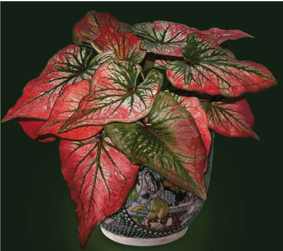
Pha Ya Ratchaphruek, hibrida Thailand. Berdaun lebar dan panjang. Tulang daun hijau tegas.