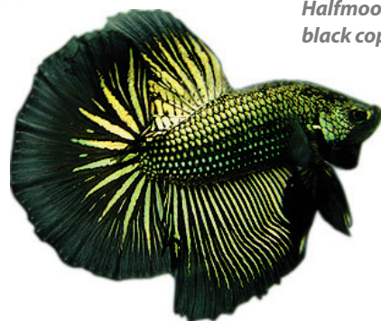
Halfmoon black copper