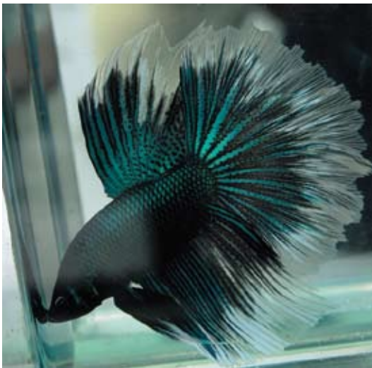
Halfmoon green copper

itu tidak hilang. “Blantong merujuk pada warna yang belang-bentong,” kata peternak yang turut mengembangkan king crowntail—serit kesohor Indonesia pada kurun 2001—2005.