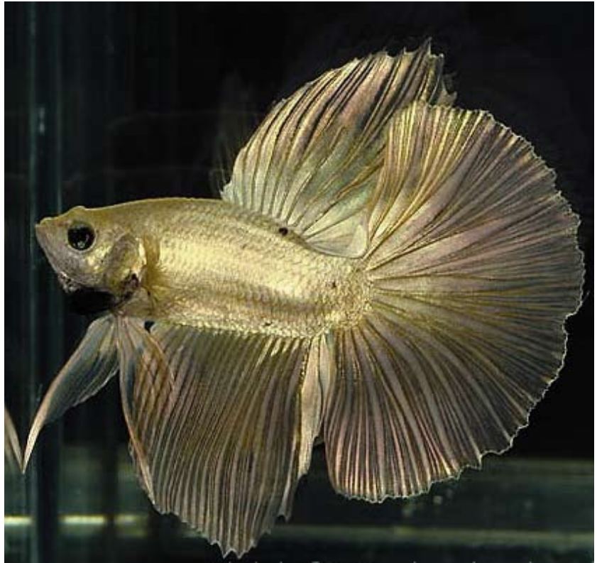
Halfmoon gold copper