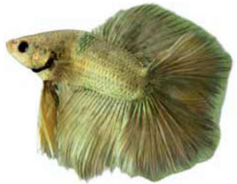
Doubletail halfmoon gold