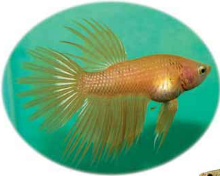
Orange gold crowntail