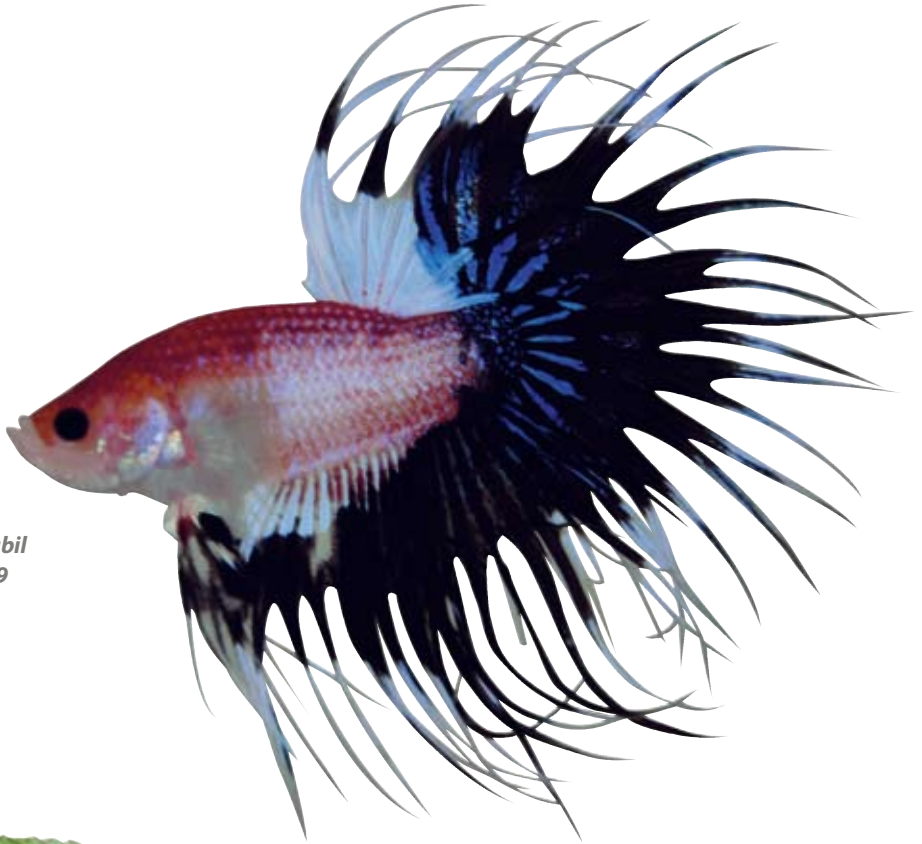
Blantong tiger, stabil pada silangan ke-9