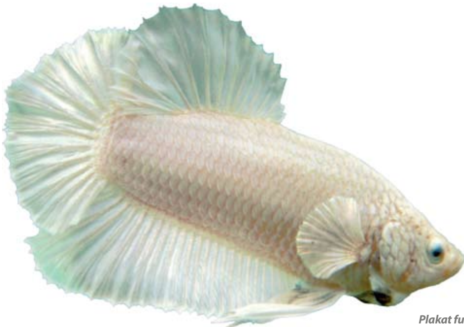
Plakat full white