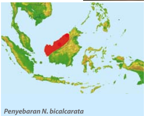
Penyebaran N. bicalcarata