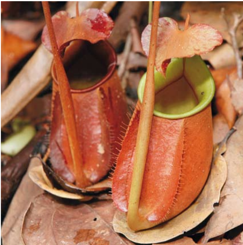
Kantong bawah N. bicalcarata