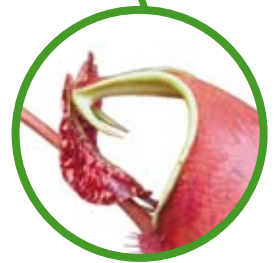
Taring N. bicalcarata