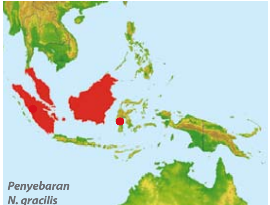
Penyebaran N. gracilis