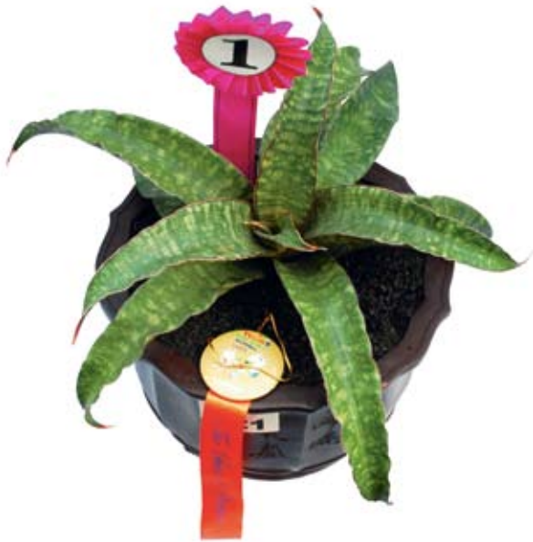
Juara ke-1 kelas daun pipih kontes sansevieria Pekan Flora Flori Tangerang, koleksi Wahidin Halim, Tangerang, Juni 2009