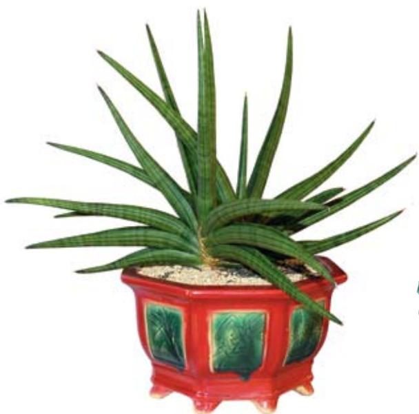
Juara ke-1 kelas nontrifasciata kontes sansevieria Bangka koleksi Dinas Kebudayaan dan Pariwisata Bangka, Maret 2009