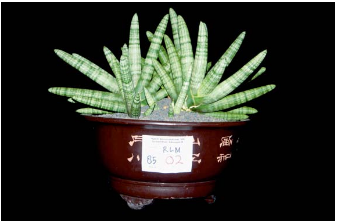
Juara ke-1 kelas roundleaf majemuk kontes sansevieria Spirit Kemerdekaan 2009, Klaten, Jawa Tengah, Agustus 2009