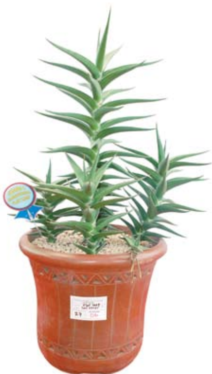
Juara ke-1 kelas flat leaf kontes sansevieria Green and Grow 1 st Anniversary di Surabaya, koleksi Saiin, April 2009