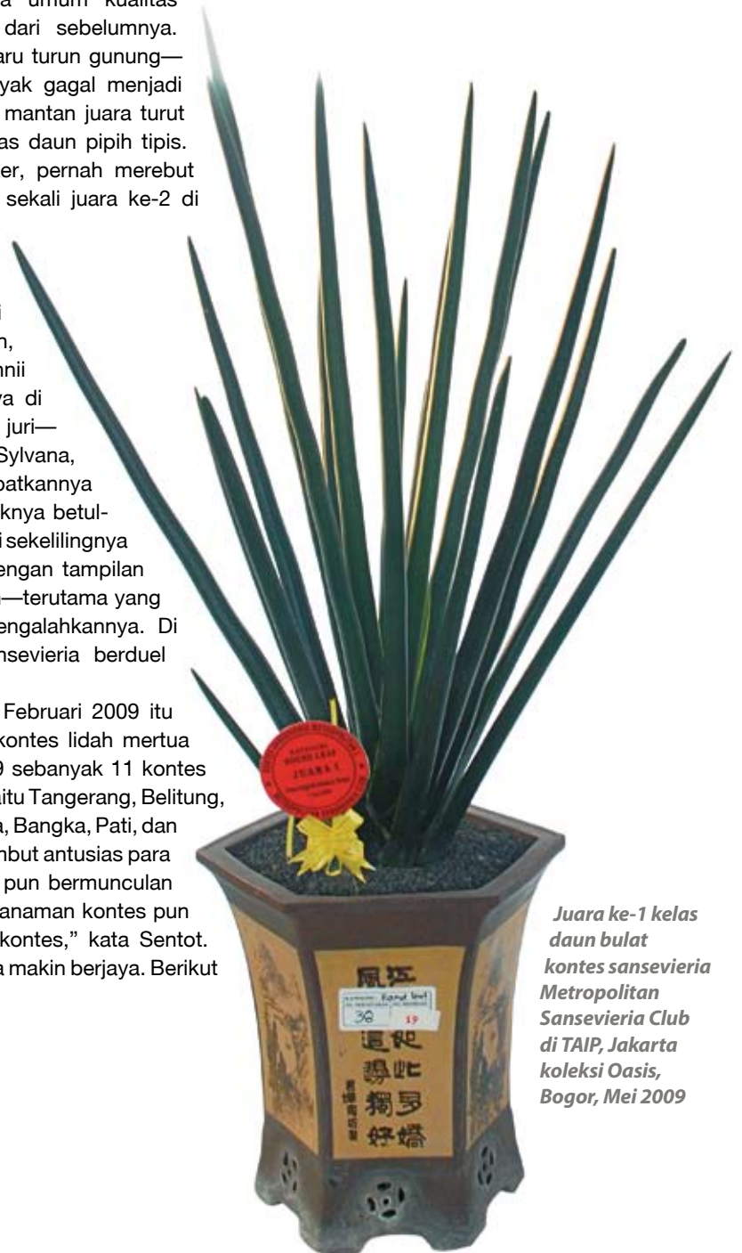
Juara ke-1 kelas daun bulat kontes sansevieria Metropolitan Sansevieria Club di TAIP, Jakarta koleksi Oasis, Bogor, Mei 2009

Sengitnya kontes pada Februari 2009 itu menjadi awal semaraknya kontes lidah mertua di tanahair. Sepanjang 2009 sebanyak 11 kontes digelar di berbagai daerah yaitu Tangerang, Belitung, Surabaya, Sumenep, Jakarta, Bangka, Pati, dan Klaten. Seluruh kontes disambut antusias para peserta. Hobiis-hobiis baru pun bermunculan di setiap daerah. “Kualitas tanaman kontes pun semakin baik pada setiap kontes,” kata Sentot. Itulah bukti pamor sang naga makin berjaya. Berikut para jawara pada 2009.***