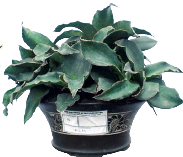
Juara ke-1 kelas flat leaf majemuk The Big Show Mitra Contest '09 di Yogyakarta, koleksi PSP, Pati, Mei 2009