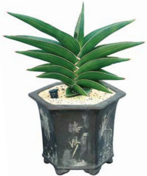
Juara ke-1 kelas nontrifasciata kontes sansevieria Gebyar Flora Fauna Belitung 2009, koleksi Oldes Nursery, Tanjungpandan, Juni 2009